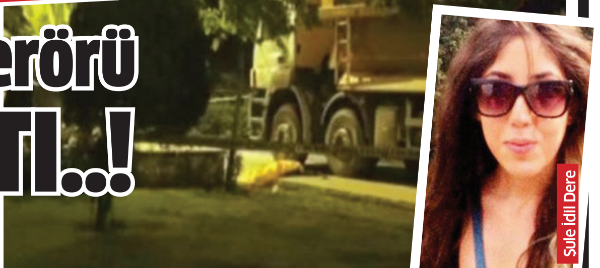
Sule İdil Dere