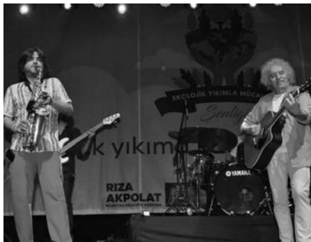
5 Haziran Dünya Çevre Günü kapsamında;