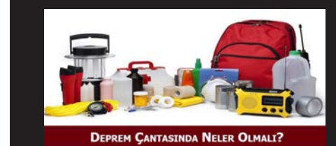
DEPREM ÇANTASINDA NELER OLMALI?

■ Tolga ÖZDEMİR - Senay GÜNCAVAR BADUR - KENT YAŞAM