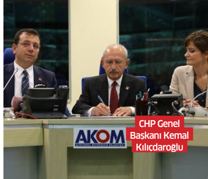
CHP Genel Başkanı Kemal Kılıçdaroğlu

Beklenen olası Marmara Depremi öncesi hükümetin açıklaması farklı, İBB'nin açıklaması farklı olunca, kafalar karıştı. Uzmanlar ise uyarıyor, "Önlem alınmaz ise İstanbul'da yaşanacak ve büyük yıkım yaratacak bir deprem Türkiye'nin bağımsızlığını tehlikeye atar. Ekonominin ve istihdamın merkezi olan İstanbul Türkiye'yi besler ama Türkiye İstanbul'u beslemekte yetersiz kalır" deniyor. Deprem kuşağında bir coğrafyada yaşadığımızı kimse inkâr etmiyor. 1999'da yaşadığımız iki deprem ve yaşanan acılar hâlâ gözyaşlarını akıtıyor ve o günün bugüne sorulan tek soru var: Depreme hazır mıyız?