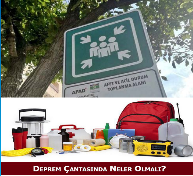
DEPREM ÇANTASINDA NELER OLMALI?