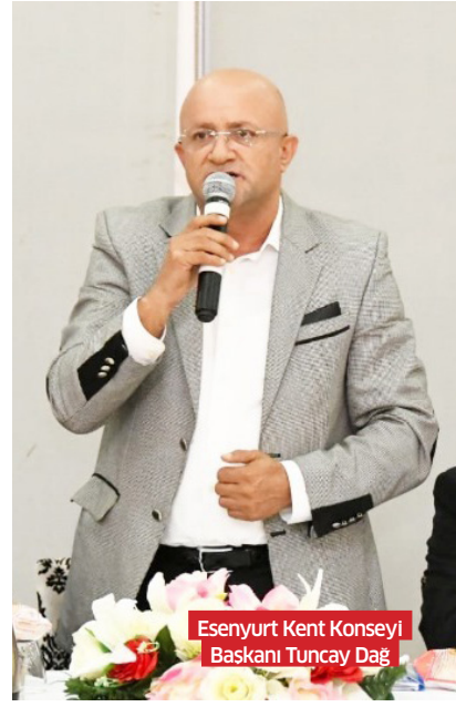
Esenyurt Kent Konseyi Başkanı Tuncay Dağ