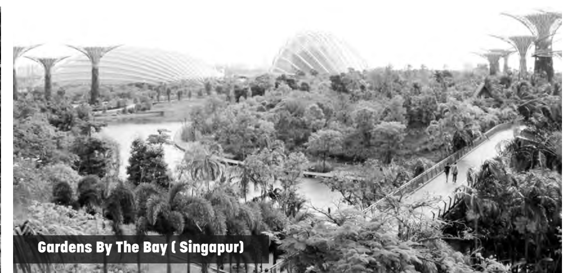
Gardens By The Bay (Singapur)