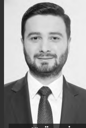
Mevlüt ÖZTEKİN KAĞITHANE BELEDİYE BAŞKANI