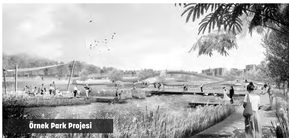
Örnek Park Projesi