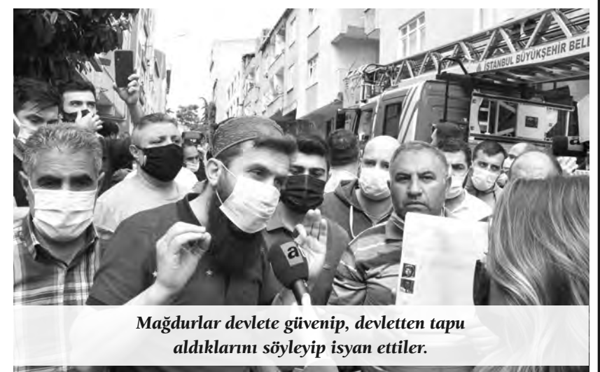
Mağdurlar devlete güvenip, devletten tapu aldıklarını söyleyip isyan ettiler.