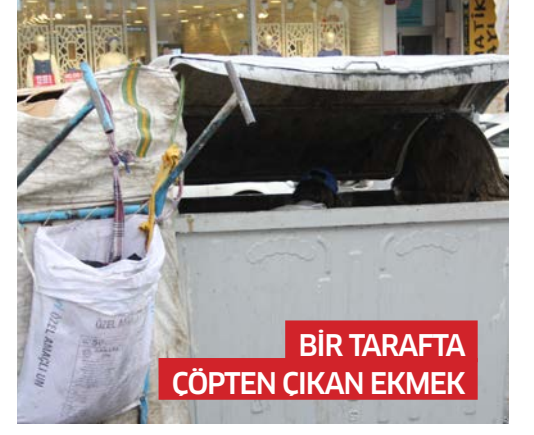
BİR TARAFTA ÇÖPTEN ÇIKAN EKMEK

Öyle bir meslek düşünün ki en az mesai harcayan kişi günde ortalama 150 ile 200 lira arası para kazansın. Günde üç-dört saat çalışsın, haftada iki gün dinlensin ve bir cümlemin ardına sığsın: "Allah rızası için bir sadaka." Trafik en yoğun olduğu bölgelerde dilencilerin yarattığı tehlikeyi bir önceki sayımızda "Trafik fırsatçıları cana mal olacak" başlıklı haberimizde işlemiştik. Peki, bu şahıslar sadece trafikte mi? İstanbul'un birçok noktasında bu şahıslarla karşılaşmak mümkün. Kimisi fiziksel engelli gibi hareket ederek, kimisi eski kıyafetler giyerek insanların duygularını sömürüyor. Ama en kötüsü ise küçük çocukları kullanarak yapılan duygusal sömürsü.