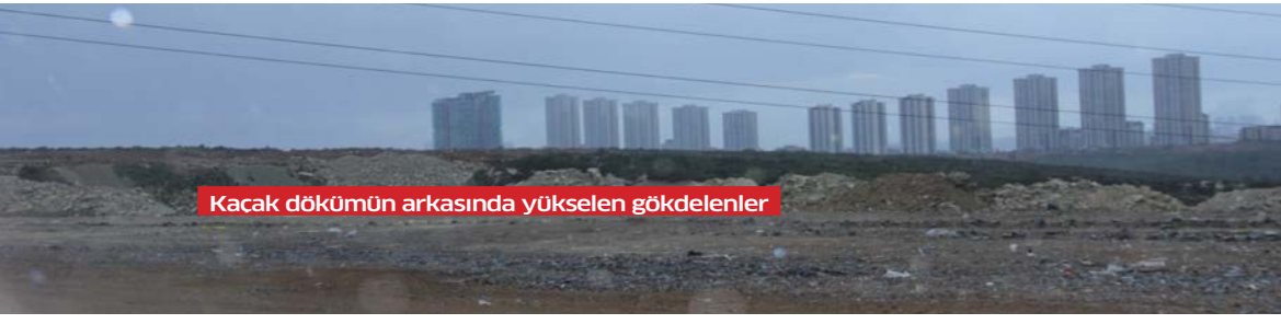
Kacak dökümün arkasında yükselen gökdelenler