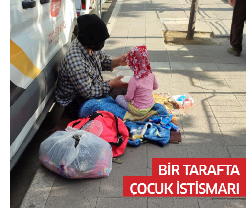
BİR TARAFTA COÇUK İSTİSMARI