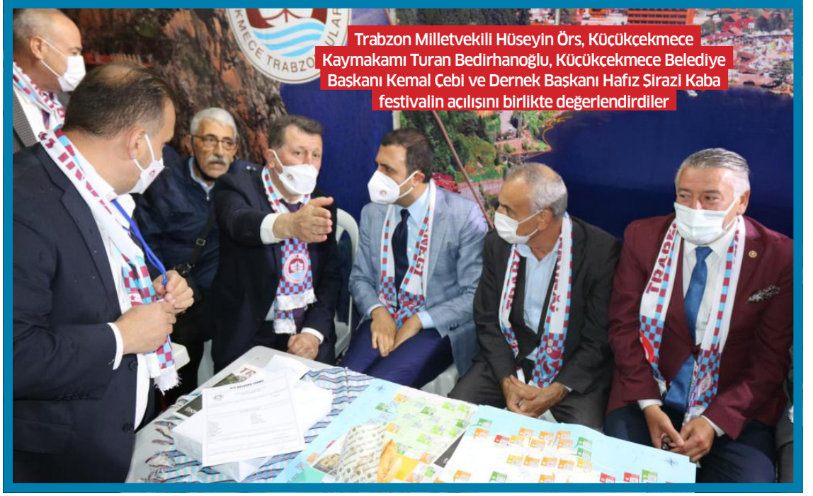
Trabzon Milletvekili Hüseyin Örs, Küçükçekmece Kaymakamı Turan Bedirhanoglu, Küçükçekmece Belediye Başkanı Kemal Cebi ve Dernek Başkanı Hafız Sırazlı Kaba festivalin açılışını birlikte değerlendirdiler.