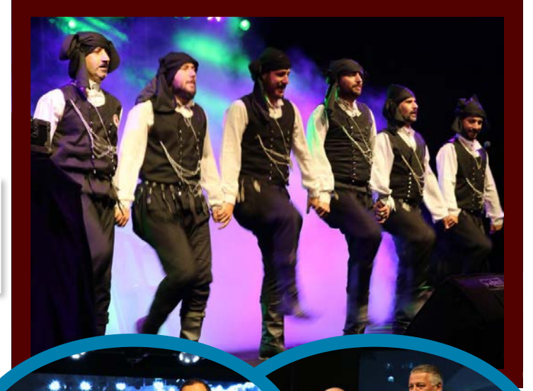
Küçükçekmece Belediyesi hemşerileri, Trabzonlu hemşerilerini daha yakından tanıma imkanı buluyor.