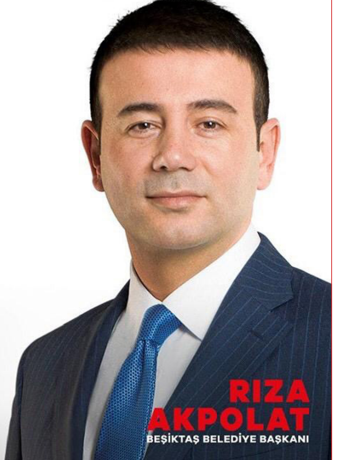
RIZA AKPOLAT BEŞİKTAŞ BELEDİYE BAŞKANI