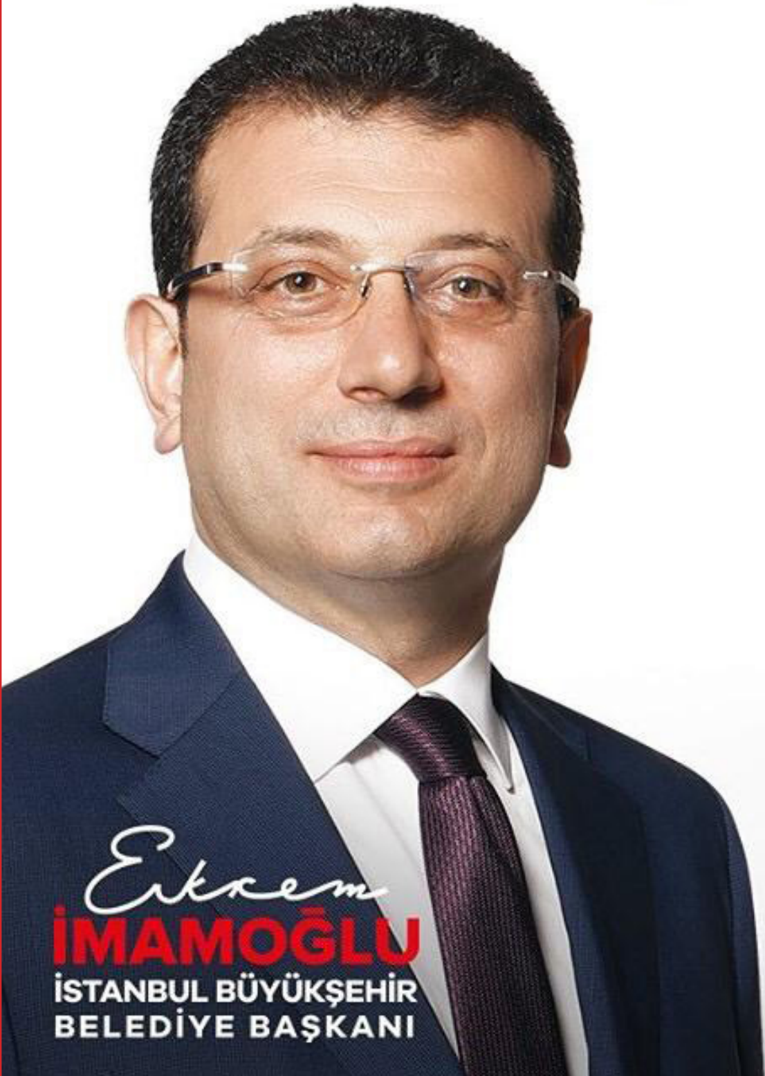
Ekrem İMAMOĞLU İSTANBUL BÜYÜKŞEHİR BELEDİYE BAŞKANI