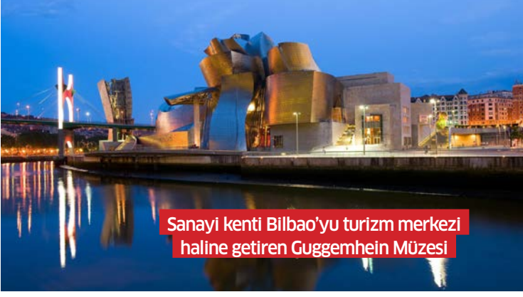
Sanayi kenti Bilbao'yu turizm merkezi haline getiren Guggemhein Müzesi