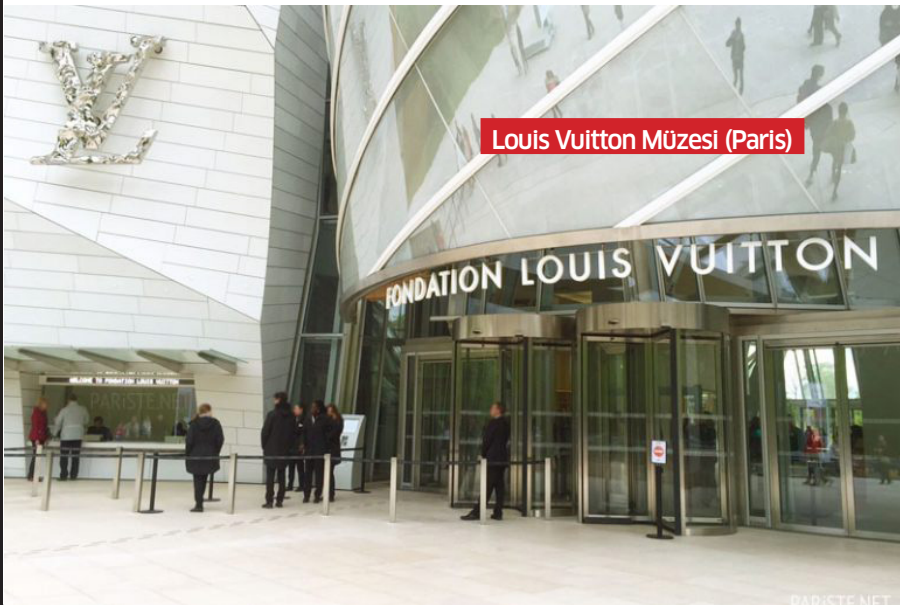
Louis Vuitton Müzesi (Paris)