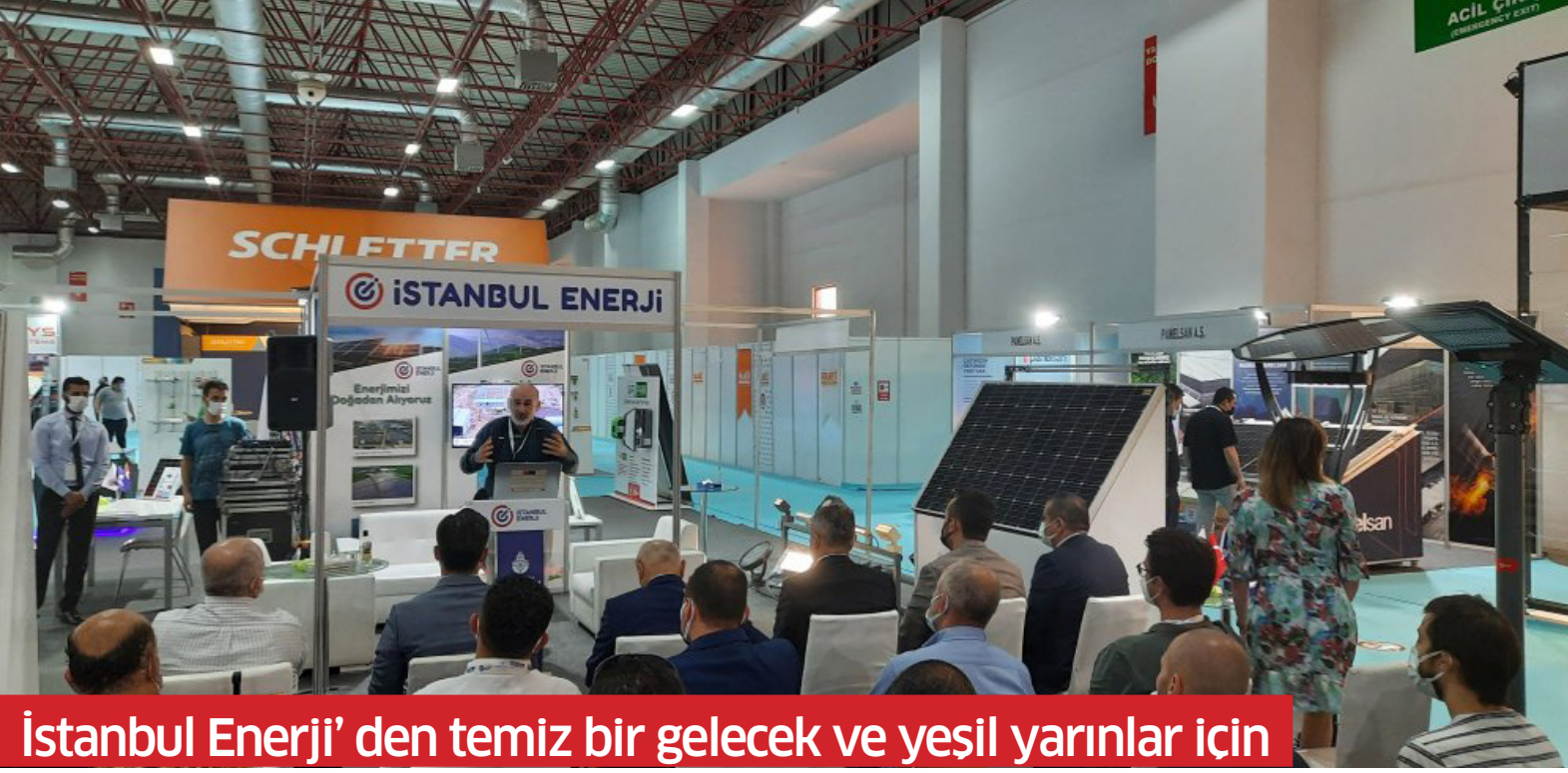
İstanbul Enerji' den temiz bir gelecek ve yeşil yarınlar için