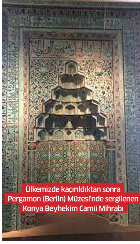
Ülkemizde kaçırıldıktan sonra Pergamon (Berlin) Müzesi'nde sergilenen Konya Beyhekim Camii Mihrabı