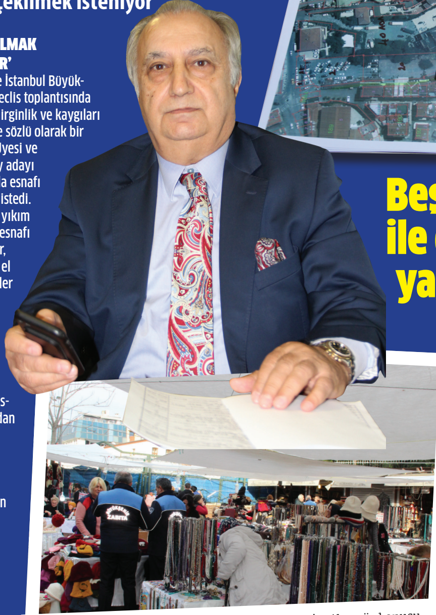
■ Esnafın bir kısmı Besiktas Belediyesi ve İBB'den söz konusu ruhsat değişikliği ile ilgili ellerine hiçbir resmi tebliğat ulaşmadan herhangi bir yere gitmeyeceklerini belirtirken, araçlarla İBB'nin Ruhsat Müdürlüğü'ne götürülen esnafın ise kendilerine imzalatılan kağıtta ne yazıldığını görmediklerini öne sürdüler...