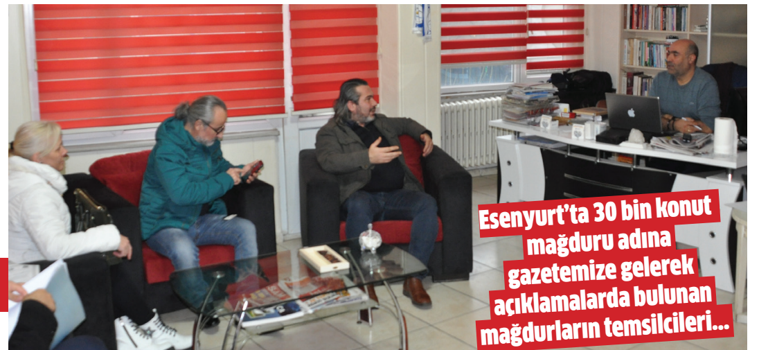
Esenyurt'ta 30 bin konut mağduru adına gazetemize gelerek açıklamalarda bulunan mağdurların temsilcileri...