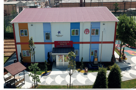
ATATÜRK MAHALLESİ GÜNDÜZ ÇOCUK BAKİMEVİ