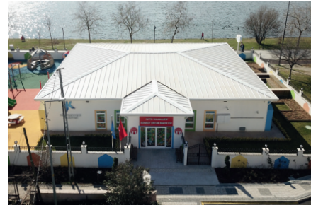
FATİH MAHALLESİ GÜNDÜZ ÇOCUK BAKİMEVİ