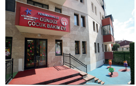
YENİ MAHALLE GÜNDÜZ ÇOCUK BAKİMEVİ