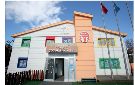
İSTASYON MAHALLESİ GÜNDÜZ ÇOCUK BAKİMEVİ