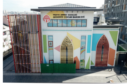
HALKALI MERKEZ MAHALLESİ GÜNDÜZ ÇOCUK BAKİMEVİ