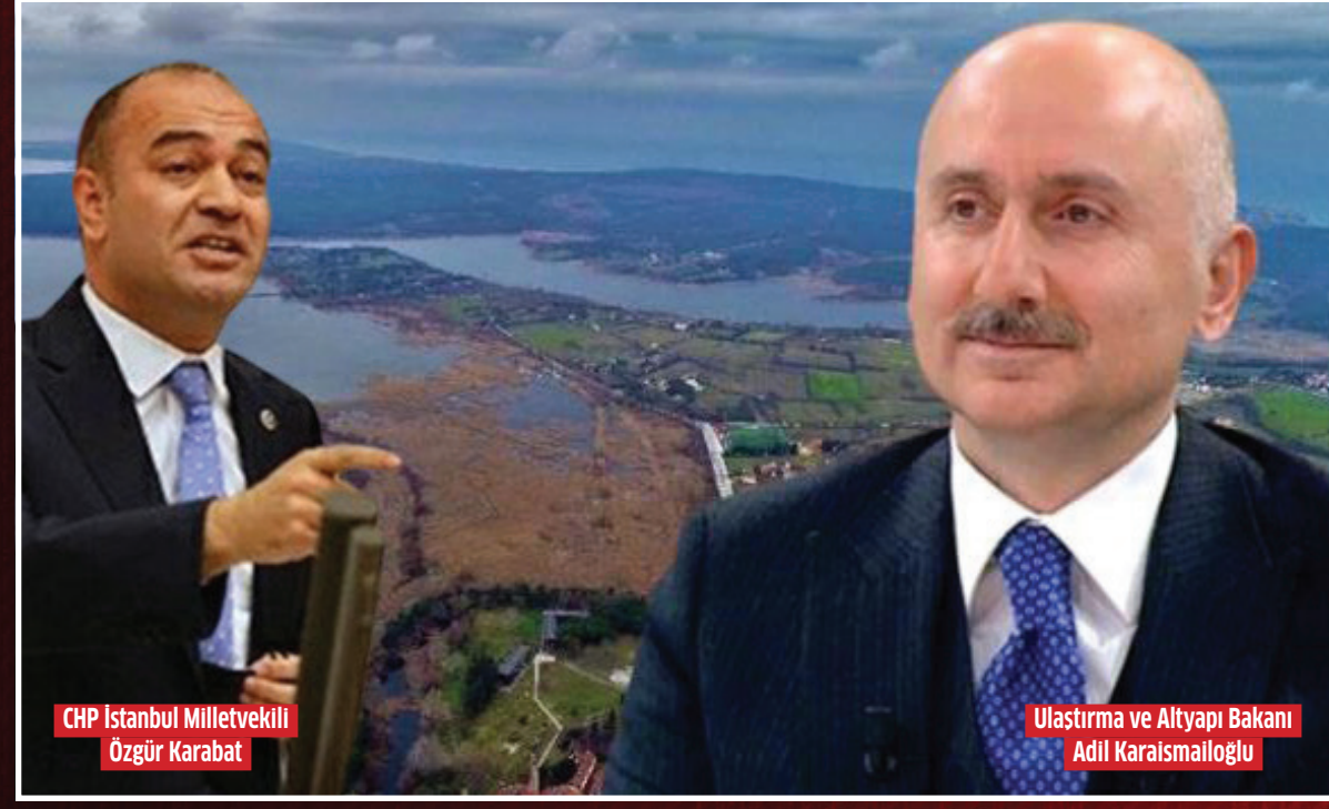
CHP İstanbul Milletvekili Özgür Karabat