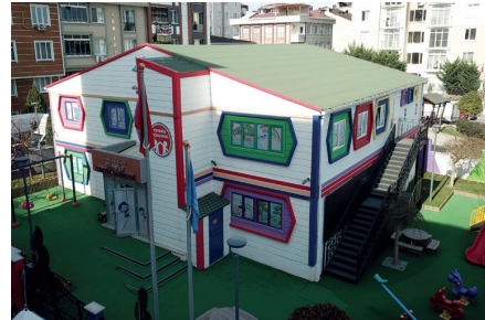
İNÖNÜ MAHALLESİ GÜNDÜZ ÇOCUK BAKİMEVİ