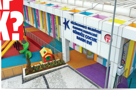
KANARYA MAHALLESİ GÜNDÜZ ÇOCUK BAKİMEVİ