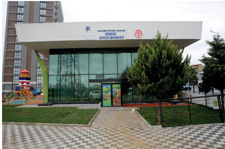
TEVFİKBEY MAHALLESİ GÜNDÜZ ÇOCUK BAKİMEVİ