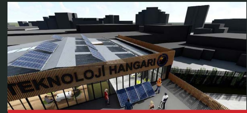
Belediye Başkanı Yüksel 'Çocukluk hayalim' demisti