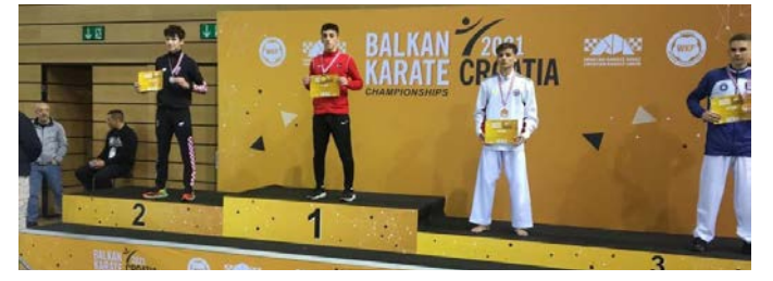
İSTE CATALCA İSTE SAMPİYON