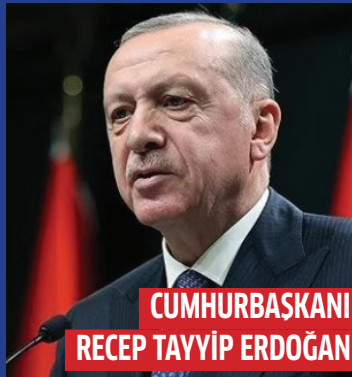
CUMHURBAŞKANI RECEP TAYYIP ERDOĞAN