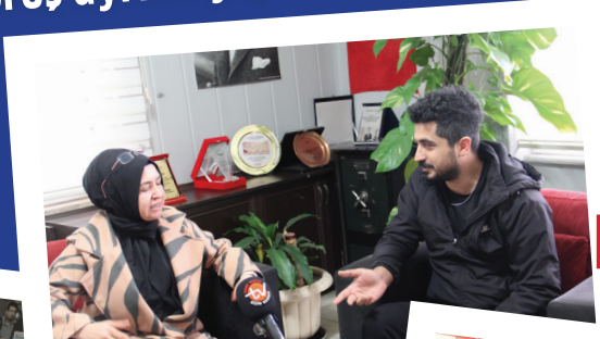
AK PARTİ İSTANBUL MİLLETVEKİLİ ŞAMİL AYRIM