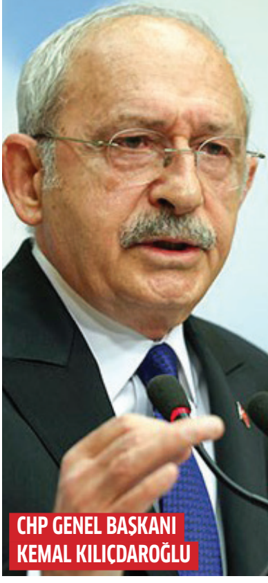
CHP GENEL BAŞKANI KEMAL KILIÇDAROĞLU