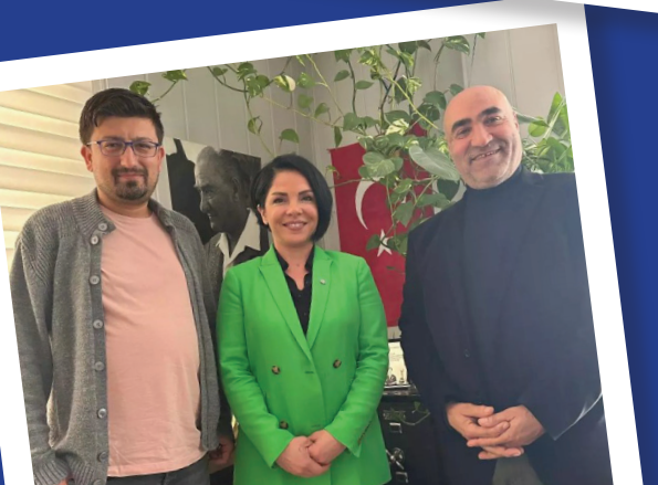
İYİ PARTİ İSTANBUL 3. BÖLGE MİLLETVEKİLİ ADAY ADAYI ÜLKÜ AYAYDIN