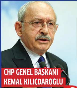
CHP GENEL BAŞKANI KEMAL KILIÇDAROĞLU

İkinci tur, yine itirazlar ve kaybeden tarafın muhtemel erken seçim talebinin ardından önümüzdeki yıl da Mart ayında yapılması öngörülen yerel seçimler derken Türkiye yine uzun bir siyasi tartışma ortamının içinde kendini bulacak gibi görünüyor. ■ 9'DA