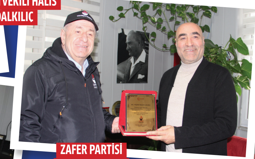
ZAFER PARTİSİ GENEL BAŞKANI ÜMİT ÖZDAĞ