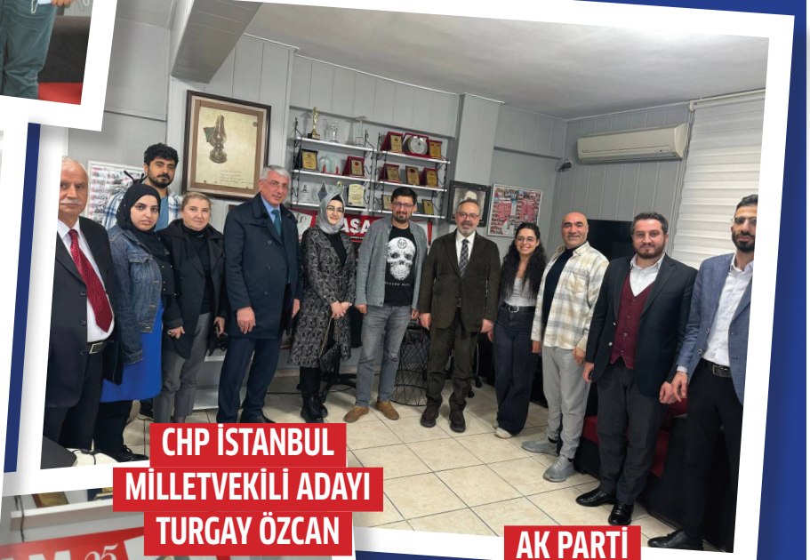
CHP İSTANBUL MİLLETVEKİLİ ADAYI TURGAY ÖZCAN