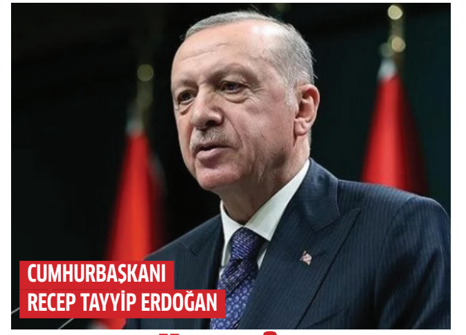
CUMHURBAŞKANI RECEP TAYYİP ERDOĞAN

Türkiye tarihinin en kritik seçimini yaparak, halk oylamaları tarihinde ilk kez "ikinci tur" kavramını deneyimleyecek. AK Parti iktidarı döneminde Cumhurbaşkanı Recep Tayyip Erdoğan da siyasi kariyerinde ilk defa bir seçimden galip ayrılmadı.