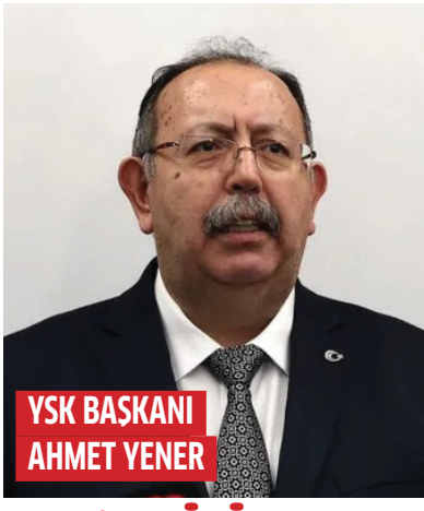
YSK BAŞKANI AHMET YENER