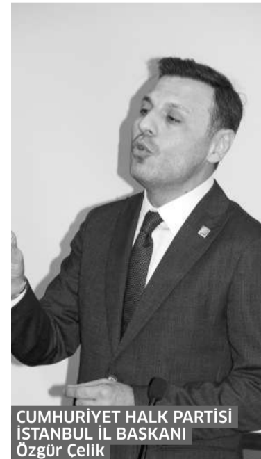
CUMHURİYET HALK PARTİSİ İSTANBUL İL BASKANI Özgür Çelik