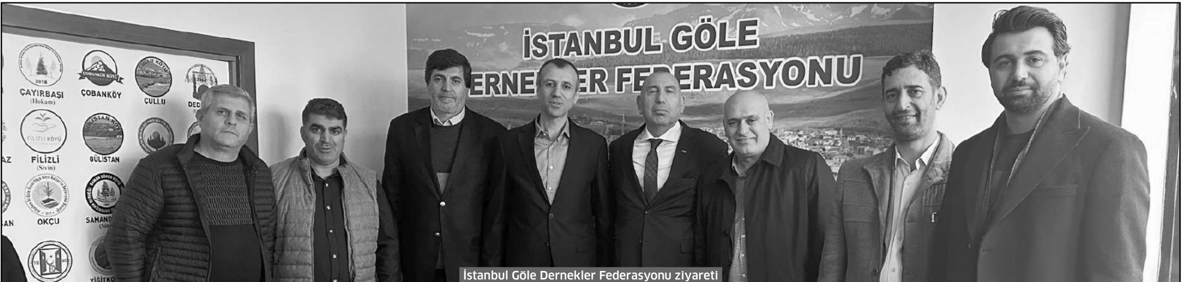
İstanbul Göle Dernekler Federasyonu ziyareti