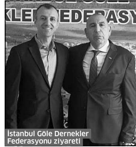
İstanbul Göle Dernekler Federasyonu ziyareti