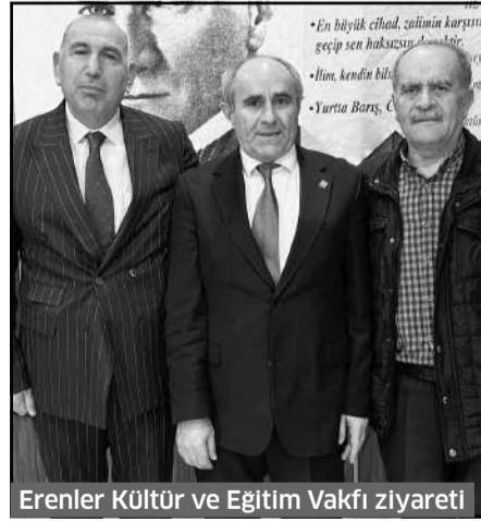
Erenler Kültür ve Eğitim Vakfı ziyareti