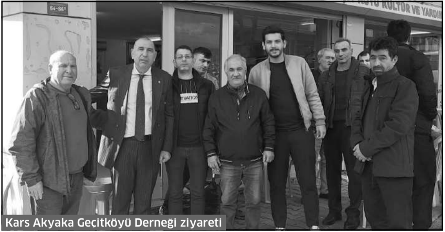
Kars Akyaka Geçitköyü Derneği ziyareti