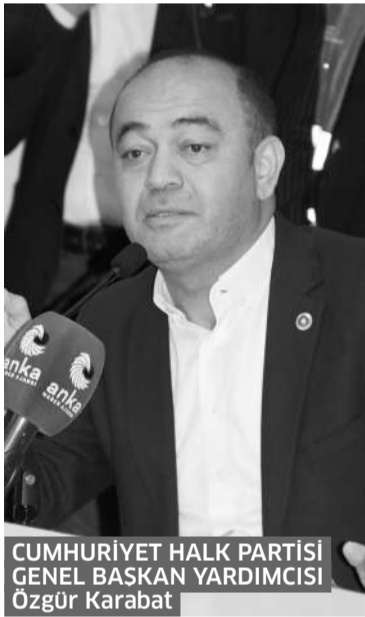
CUMHURİYET HALK PARTİSİ GENEL BAŞKAN YARDIMCISI Özgür Karabat

Seçim çalışması kapsamındaki mesajını da veren Kayabaşı, "Buradan İstanbul'a ve Türkiye'ye umut olacak çalışmamızı başlattığımızı ve bu çoban ateşini buradan yaktığımızı bir kez daha ilan ediyorum, geldiğiniz için sizlere teşekkür ediyorum." ifadelerini kullandı.