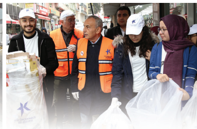
İKLİM VE SIFIR ATIK MÜDÜRLÜĞÜ