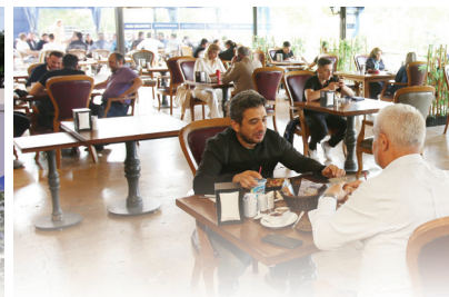
SOSYAL TESİSLERİMİZDE ÇAY 1 TL