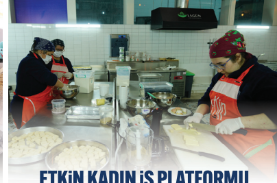
ETKİN KADIN İŞ PLATFORMU KÜÇÜKÇEKMECE KADIN GİRİŞİMİ ÜRETİM VE İŞLETME KOOPERATİFİ