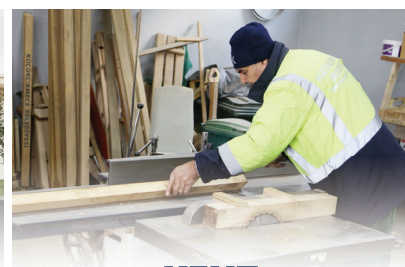
KENT MOBİLYALARI ATÖLYESİ