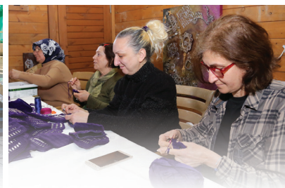
KADIN AİLE HİZMETLERİ MÜDÜRLÜĞÜ