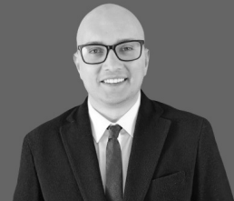
Av. BÜNİYAMİN GÜNEY