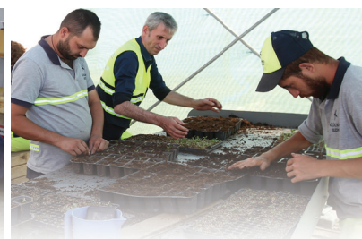
SERA ÜRETİM MERKEZİ

SOSYAL BELEDİYECİLİĞİN ADRESİ KÜÇÜKÇEKMECE!