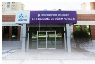
3 AİLE DANIŞMANLIK MERKEZİ