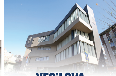
YEŞİLOVA MAHALLESİ YAŞAM MERKEZİ