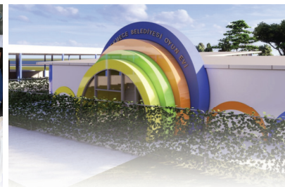
Bi'MOLA YAŞAM MERKEZİ