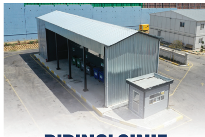
BİRİNCİ SINIF ATIK GETİRME MERKEZİ