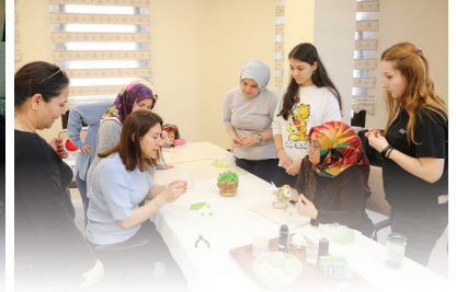
KADIN EŞİTLİK MERKEZİ