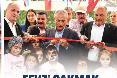
FEVZİ ÇAKMAK MAHALLESİ OYUNEVİ