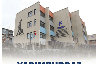
YARIMBURGAZ MAHALLESİ YAŞAM MERKEZİ