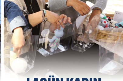
LAGÜN KADIN DAYANIŞMA MERKEZİ