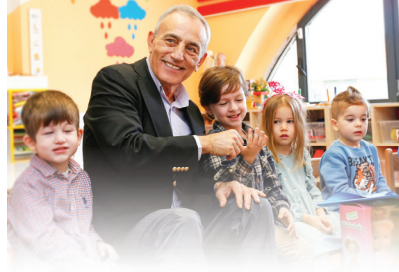
15 GÜNDÜZ ÇOCUK BAKIMEVİ