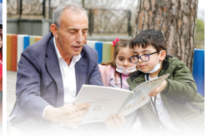
2 ÇOCUK KÜTÜPHANESİ