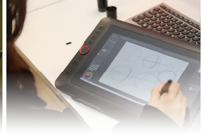
VIDEO ART STÜDYOSU