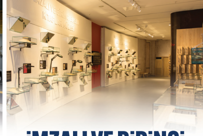
İMZALI VE BİRİNCİ BASKI KİTAPLAR MÜZESİ