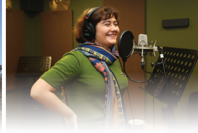
MÜZİK AKADEMİSİ KAYIT STÜDYOSU