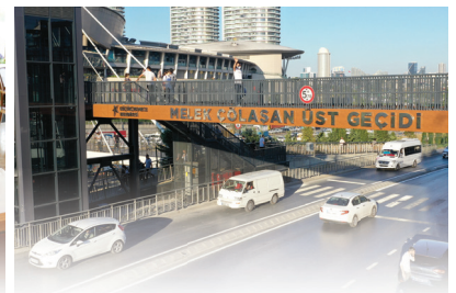
MELEK ÇOLAŞAN ÜST GEÇİDİ