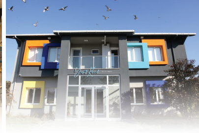
YAŞAR KEMAL ŞANATEVİ