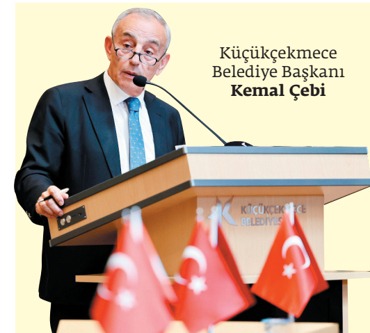
Küçükçekmece Belediye Başkanı Kemal Çebi

haberyasamda gazetekentyasam Kent Yaşam Gazetesi Kent Yaşam TV www.yasamgazetesi.com.tr 20 NİSAN 2024 CUMARTESİ www.yasamgazetesi.com.tr FİYATI: 35 TL YIL: 30 SAYI: 1189 15 GÜNDE BİR YAVINLANIR