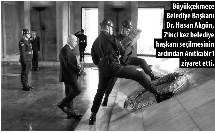
Büyükçekmece Belediye Başkanı Dr. Hasan Akgün, 7'inci kez belediye başkanı seçilmesinin ardından Anıtkabir'i ziyaret etti.

Başkan Akgün Anıtkabir Anı Defterine şunları yazdı: "Yolundan bir an olsun ayrılmadığımız Büyük Önderimiz! Büyükçekmece halkının 1994 yerel seçimlerinden bu yana Belediye Başkanlığıyla 7. kez yine şahsımı görevlendirmelerinin onuruyla, bir kez daha ebedi istirahatgahınızda minnet ve şükranla huzurunuzdayım; değerli hatıralarınız önünde saygı ve sevgiyle eğiliyorum. Büyükçekmece halkı adına, ülkenin modernleşmesi ve çağdaşlaşması için büyük bir vizyon ve liderlikle kurduğunuz Cumhuriyet'in ışığında, eği-