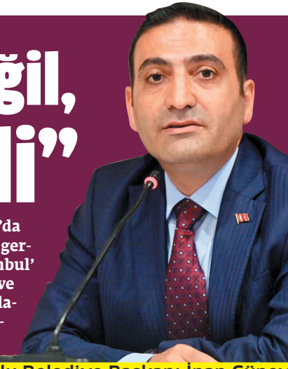
Beyoğlu Belediye Başkanı İnan Güney

4 Haziran Salı günü saat 19.00'da Göl Kenarı Amfi Tiyatro'da açılışı gerçekleştirilecek olan 'V. Masalİstanbul' Festivali'nde ülkemizden ve İran ve Marakeş'ten gelen masal anlatıcıları, 5 gün boyunca masallarla kalplere barış tohumları ekmeye hazırlanıyor. ■ 7'DE