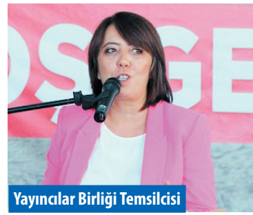
Yayınlar Birliği Temsilcisi

Milletvekili adaylığı serüvenini de anlatan Kongar, "Türkiye'de tarih yanlış veya yüzeysel öğretiliyor. Asıl tarihi öğrenmeniz için çok okunması gerekir. Size Cumhuriyet döneminin gerçek anlamda öğrenebileceğiniz bir kitap önermek istiyorum. Şevket Süreyya Aydemir'in 3 ciltlik Tek Adam kitabı bu anlamda güzel bir ışık tutacaktır. Türkiye'de 1945'lerin ardından Atatürk'ün tahayyül ettiği Cumhuriyetten uzaklaşmış ve tekrar tarım toplumuna başlamıştır. Şimdiki yaşadığımız ortam da bunun bir sonucudur." dedi.