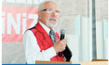
Prof. Dr. Reşit Emre Kongar, Türk Toplum Bilimci ve Akademisyen

Küçükçekmece'de bu etkinliklere devam edeceğiz. Birileri diyor ya itibardan tasarruf olmaz diye. Biz o sözü edebiyata, sanata, eğitime ve yatırıma uyarlıyoruz."