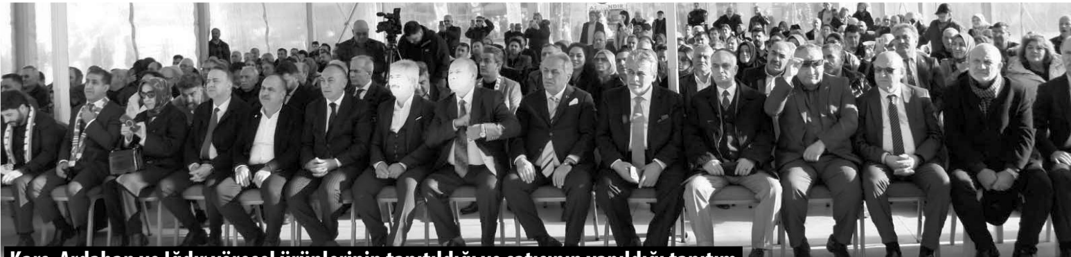
Kars, Ardahan ve Iğdır yöresel ürünlerinin tanıtıldığı ve satışının yapıldığı tanıtım günleri, 9-12 Ocak tarihlerinde Kağıthane Hasbahçe'de yapıldı.