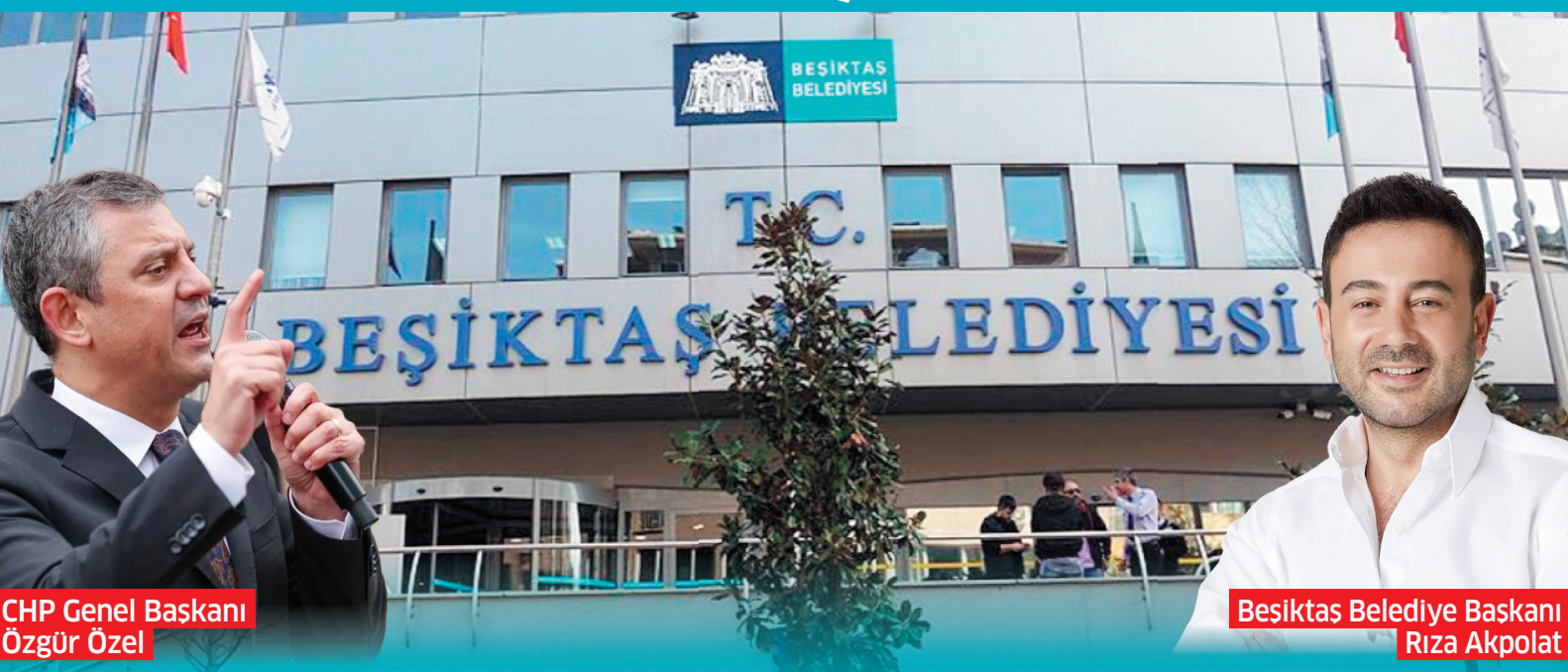
CHP Genel Başkanı Özgür Özel