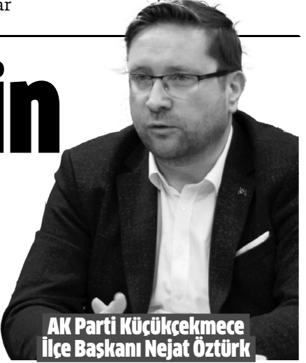
AK Parti Küçükçekmece İlçe Başkanı Nejat Öztürk