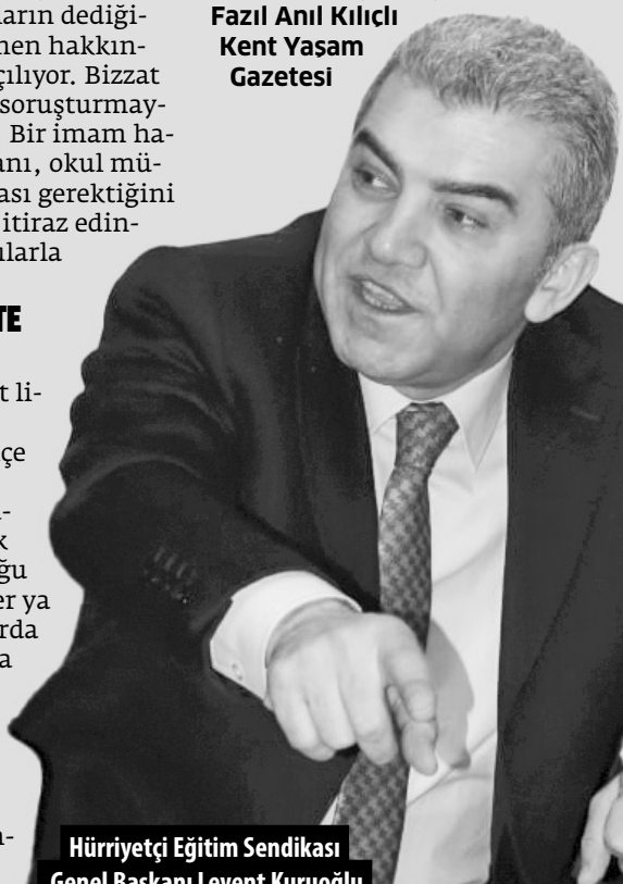
Hürriyetçi Eğitim Sendikası Genel Başkanı Levent Kuruoğlu